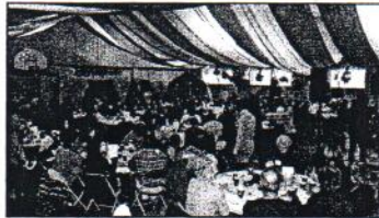
Lors de l'édition 2012 du Brunch interculturel.

Les participants vont déguster des mets québécois et exotiques provenant de neuf pays différents. De plus, ils assisteront à des spectacles de musique du Québec, de