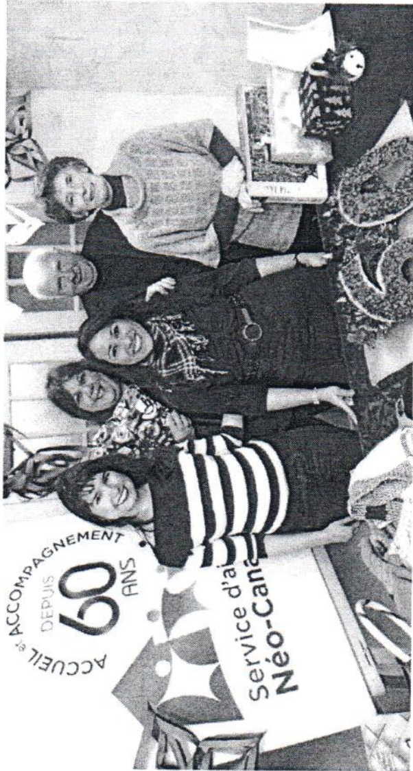
IMAGIN. RENÉ MARQUIS

« Toutes les décorations pour la salle ont été fabriquées par nos bénévoles. Ça nous permet de respecter notre budget limite et c'est très valorisant pour ceux-ci de participer activement à la réalisation de cet événement. Sans leur aide précieuse, la tenue de