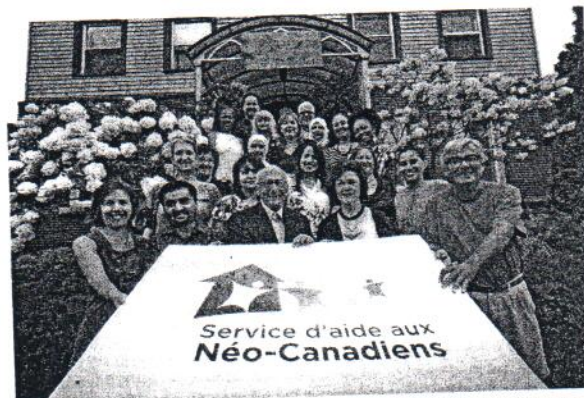
UNE PARTIE DE LA DYNAMIQUE ÉQUIPE DU SERVICE D'AIDE AUX NÉO-CANADIENS ENTOURANT FIÈREMENT LA NOUVELLE IDENTITÉ VISUELLE DE L'ORGANISME.

Fondé en 1954, le Service d'aide aux Néo-Canadiens, organisme à but non lucratif, s'est donné pour mission d'accueillir et d'accompagner les personnes immigrantes en Estrie dans leur cheminement en vue de leur intégration à la vie socioéconomique et de contribuer au rapprochement interculturel. L'organisme offre des services d'accueil et d'accompagnement, d'interprétriariat, d'hébergement temporaire, de même que des services d'accès au travail. De plus, il assure la liaison avec les réseaux de la santé et des services sociaux et avec le milieu scolaire.