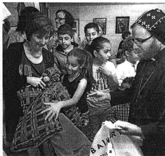
Comme communauté d'accueil, Sherbrooke parvient à répondre à l'essentiel des besoins matériels des familles arrivées de la Syrie. Le succès est cependant beaucoup plus timide au chapitre de l'emploi.

frontières, bien les accueillir, si on n'aide pas ces gens à trouver du travail, ils vont se décourager. Il faut leur donner une chance de se faire valoir », plaide à nouveau M. Turk.